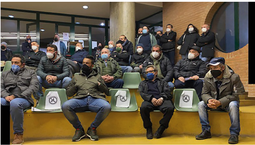
Una parte degli allevatori presenti all'incontro di Avellino

Questa iniziativa presa da ANABIC ed ARA CAMPANIA-MOLISE, che ringraziamo per la grande disponibilità manifestata, è stata molto importante perché ha rafforzato il legame tra l'ANABIC e le Associazioni Allevatori che sono presenti nel territorio per dare risposte concrete ed efficaci agli allevatori che hanno fortemente apprezzato l'iniziativa. È nostra intenzione ripeterla in tutte le regioni, in collaborazione con le ARA presenti nel territorio, per ravvivare il contatto diretto con i soci (che era stato purtroppo interrotto dalle vicende legate alla pandemia da COVID-19) e per rinsaldare un legame fondamentale tra gli allevatori e le proprie Associazioni, che non può mai venir meno perché è strategico e fondamentale per affrontare con successo le sfide che attendono le aziende.