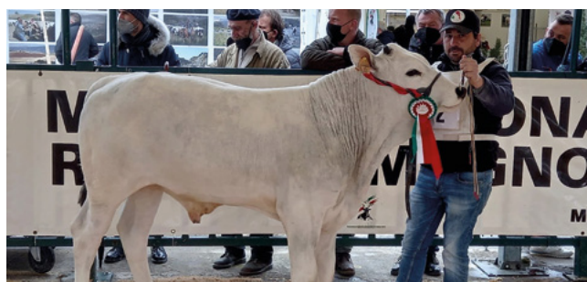
News, Campione Riserva Maschi Junior - Flli Luchetti M. e M. (Pg)