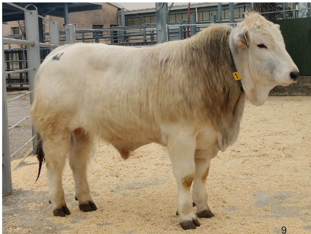
La Fattoria Nobile, top price della razza Romagnola: all.to Donati Emilio (RA)