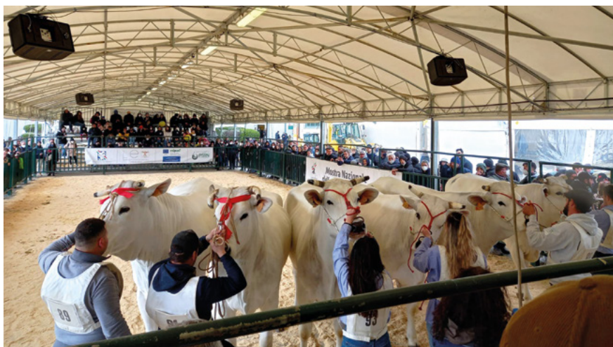
Un momento delle valutazioni