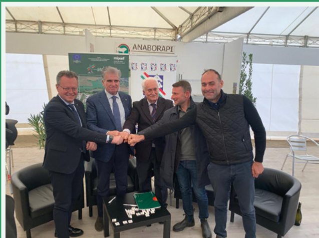
Siglato il protocollo per il "Polo delle carni Italiane"

Questo protocollo è arrivato finalmente dopo vari anni di lavoro e di collaborazione con le Associazioni degli allevatori italiani, al fine di rendere la manifestazione di Agriumbria il punto di riferimento del mercato e della valorizzazione dei bovini da carne in Italia. Questo accordo garantisce la presenza di almeno una Mostra Nazionale del Libro Genealogico unitamente a iniziative volte a promuovere la qualità delle produzioni delle nostre carni.