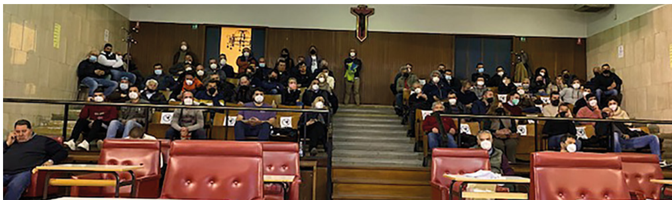
Una parte degli allevatori presenti all'incontro

P er una Associazione come ANABIC, il contatto diretto con i propri soci è fondamentale e deve rappresentare il momento più rilevante del rapporto associativo. E' su questa premessa che ANABIC, ha ripreso, dopo la forzata pausa causata dal COVID, ad organizzare incontri sul territorio con i propri allevatori per affrontare le tematiche più emergenti legate al percorso di selezione e di miglioramento genetico delle nostre razze e per mettere a punto le regole ed i comportamenti corretti richiesti dall'iscrizione al Libro Genealogico.