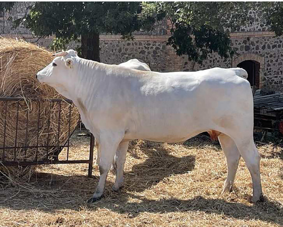
Farfalla, una fattrice dell'allevamento

unicamente ricorso alla FA e provvedo personalmente alle fecondazioni.