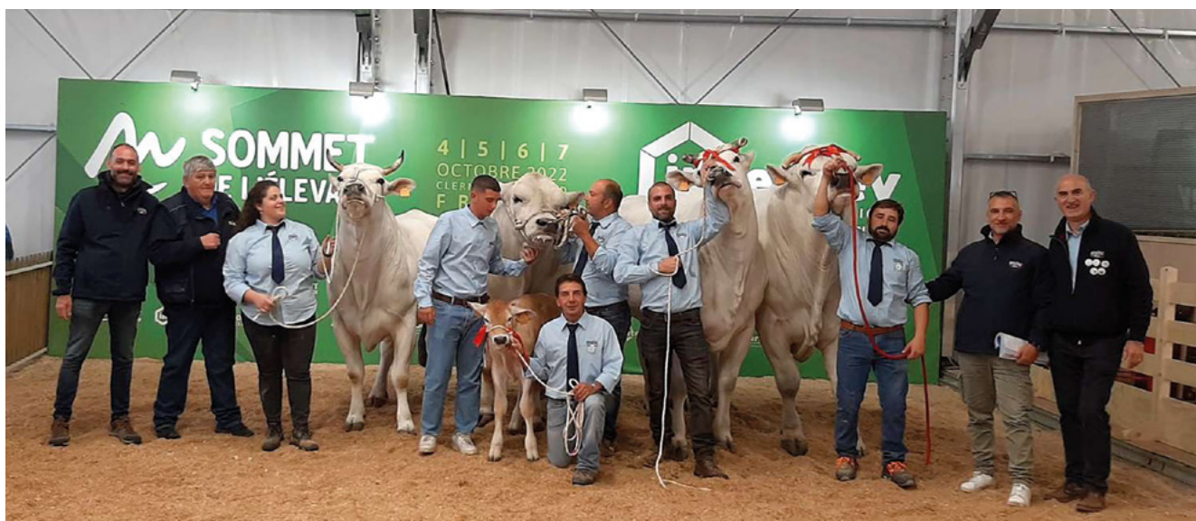
Le razze bianche sul ring del Sommet

Interesse a apprezzamento per i bovini da carne ANABIC in mostra al Sommet de l'Élevage di Clermont Ferrand