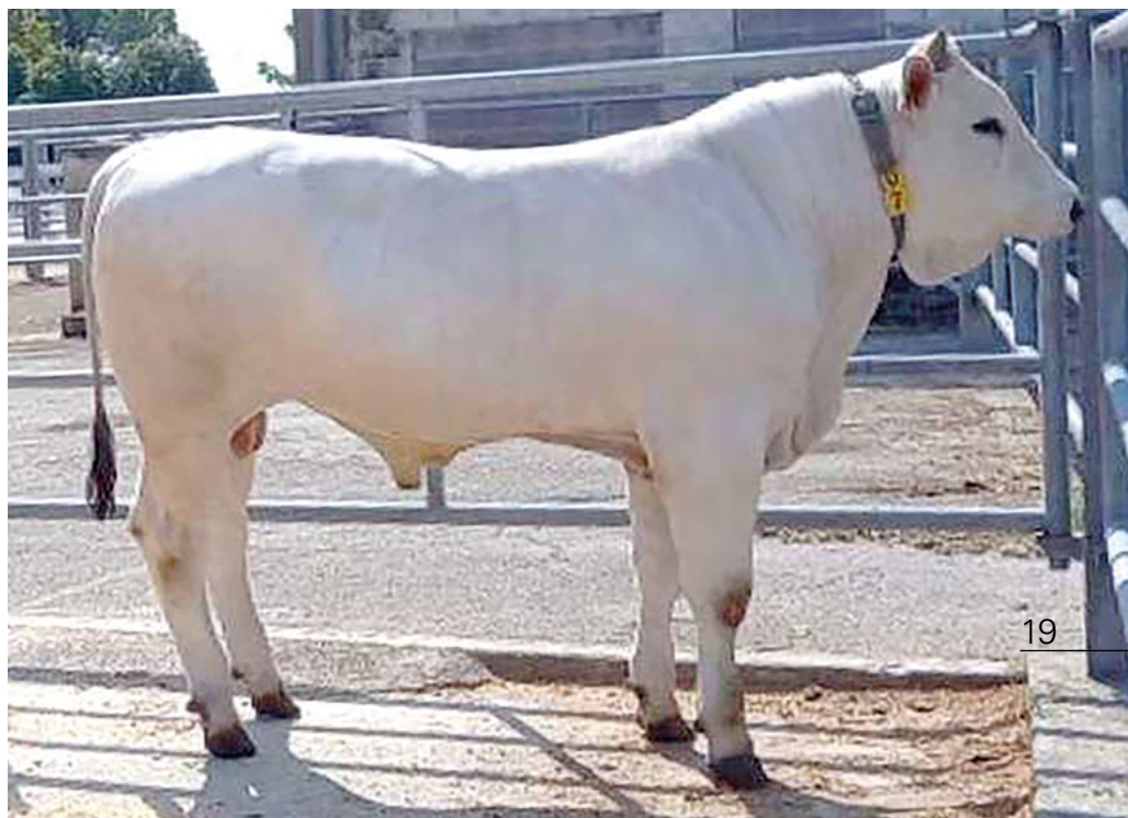
Mezcal, un toro in asta al Centro Genetico

Da appassionato della Chianina e di bestiame in generale, credo che per crescere occorra puntare ai vertici dandosi degli obiettivi e cercando di perseguirli con determinazione. In questo percorso il supporto di Anabic è fondamentale; sono soddisfatto in particolare del rapporto con i suoi tecnici, che è diventato più stretto da quando sono diventato esperto di razza per la Chianina e successivamente anche per la Maremmana. Il ruolo di valutatore mi permette inoltre di approfondire la conoscenza delle razze in oggetto oltre che di venire a contatto con le più disparate realtà di allevamento e le relative soluzioni gestionali.