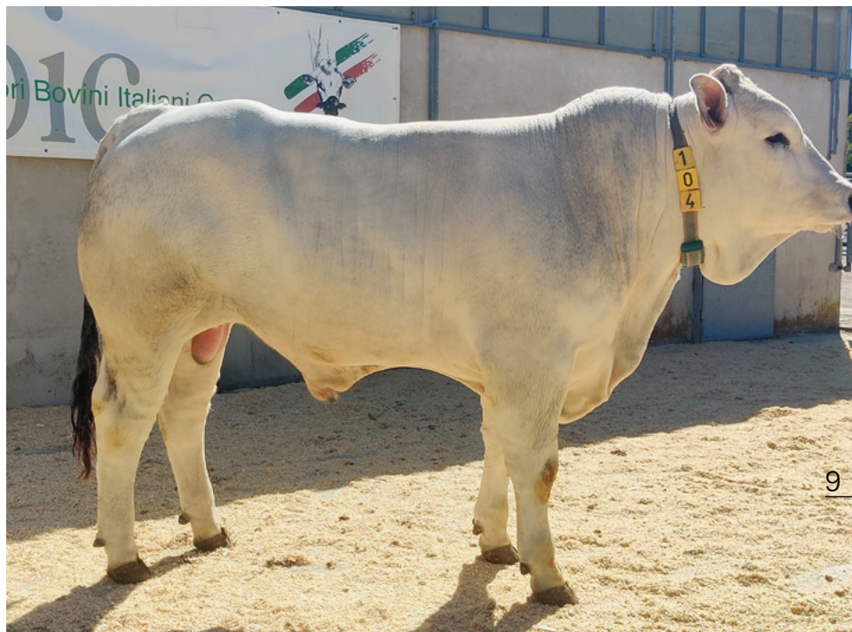
La Fattoria Nilo, top price della razza Romagnola; all.to Donati Emilio (RA)