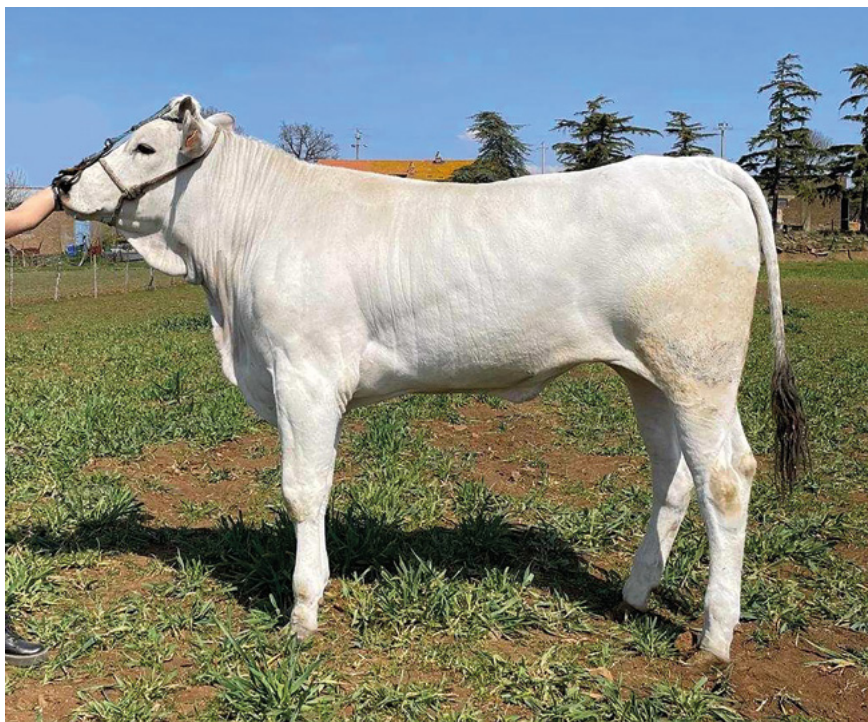
Miledi, una manza presentata a Bastia Umbra 2022

Facendo unicamente ricorso alla FA cerco di avere nel tank un campionario aggiornato dei migliori riproduttori per poter ottimizzare le mie scelte in materia di accoppiamenti. A tale proposito mi piacerebbe che tutti i migliori riproduttori in uscita dal centro genetico fossero sottoposti al prelievo del materiale seminale e resi disponibili agli allevatori, cosa che purtroppo non è sempre possibile.