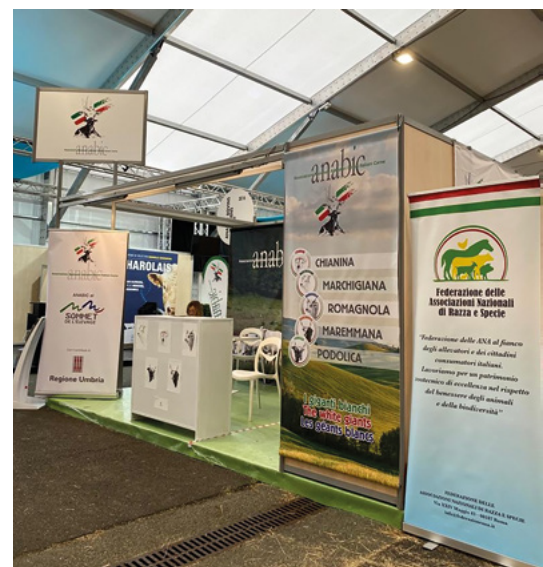
Lo stand ANABIC

importanti della Francia, quest'anno ha contato in mostra più di 400 capi. Si fa presto a capire la portata di questa manifestazione distribuita su oltre 15 ettari di spazio espositivo e molto concentrata, legittimamente, sulle razze francesi. Essere riusciti da neofiti di questa kermesse a suscitare attenzione e soprattutto interesse vuole dire aver centrato l'obiettivo che ci eravamo posti: far conoscere con competenza l'eccellenza di alcune tra le principali razze di bovini da carne italiane". Numerosi sono stati i contatti